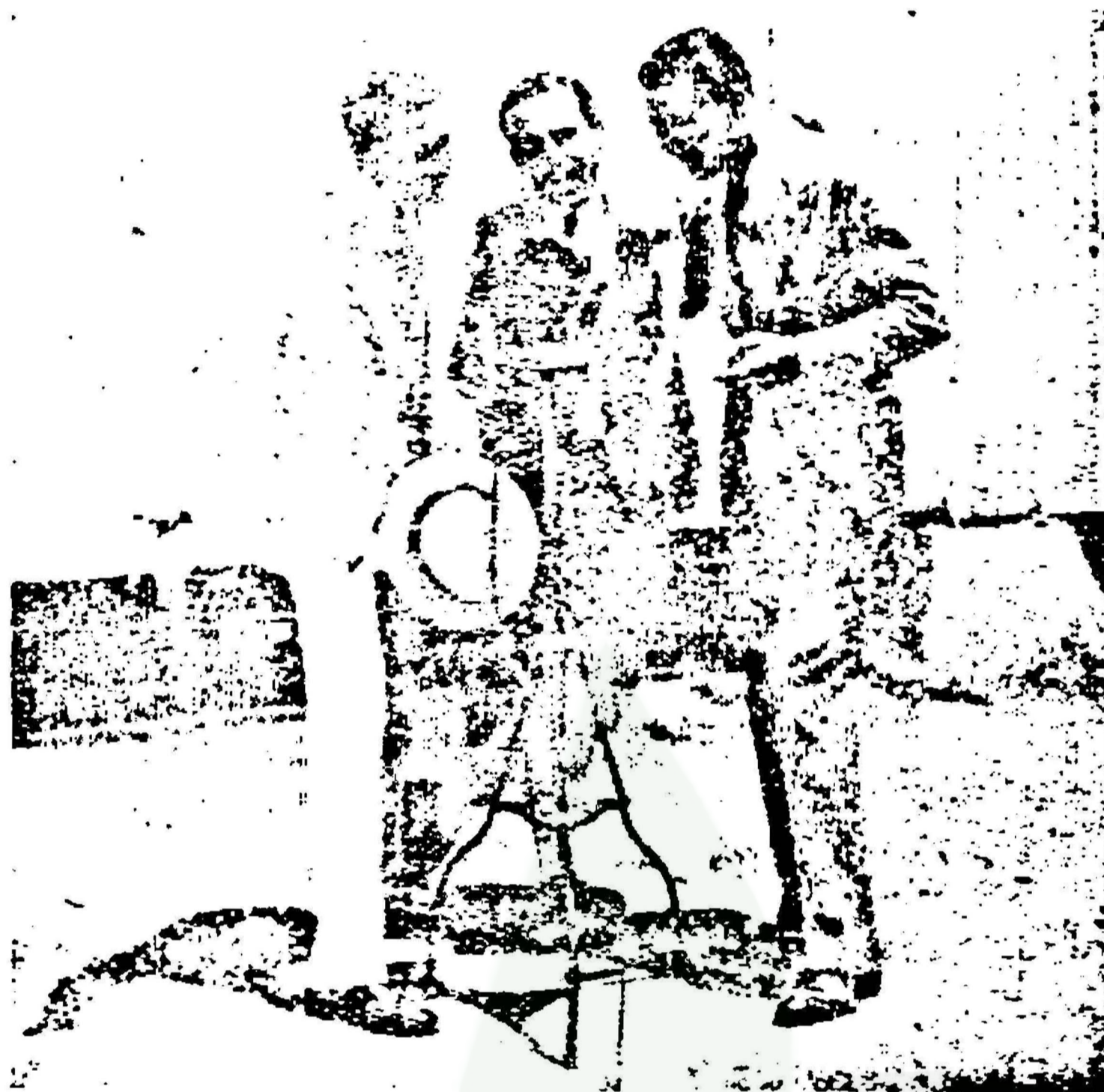
Douglas Mae Lean, Harold Lloyd deung Ben Lyon keur nj rita dina toestet peranti usrikeun soara.

Leila Hyams teh hidji bintang snier sanggeus manehna 5 ta oen ka toekang digawe di kalangan film. Dina productie „Sondra“ kageulisanna geus kabieumen koe roepa Barbara La Marr noe ajeuna geus euweuh dikieuna. Koe sabab ajeuna sja film njo ra tea, Leila Hyams manehna loempat deui ka pakalangan sarta ngabogaan sora noe teu kelehkeun koe beureut beungetina.