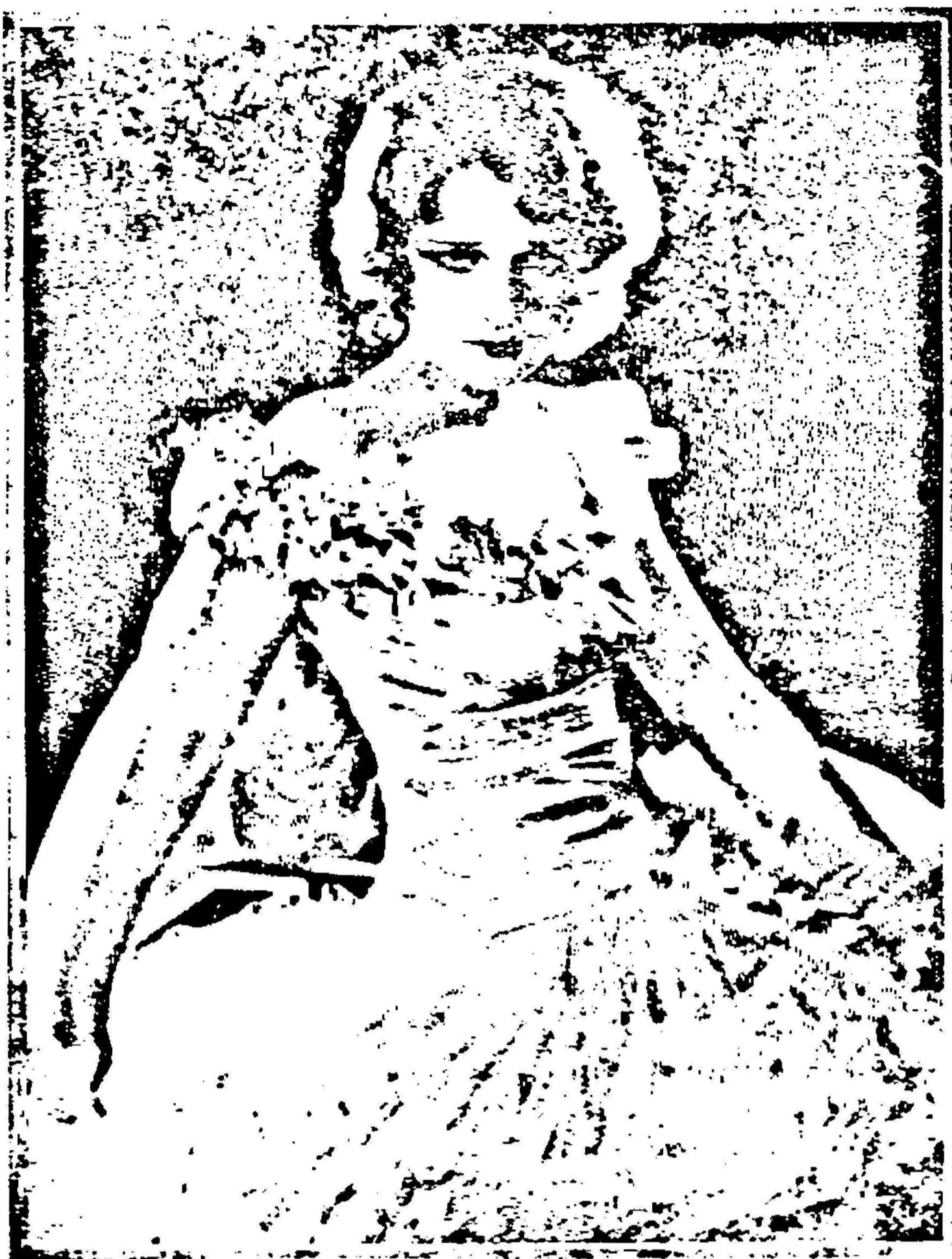
Saha noe kien?