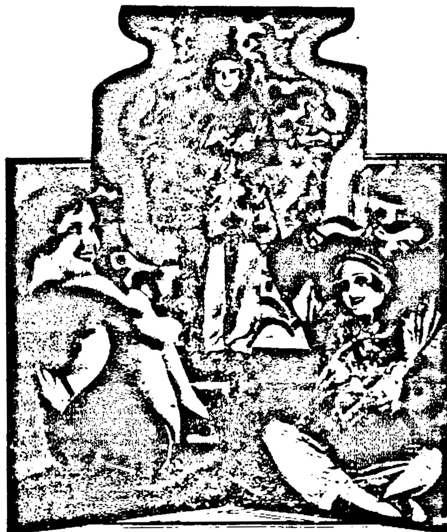
Scene tina productie The Insidious Dr. Fu. Manchu.