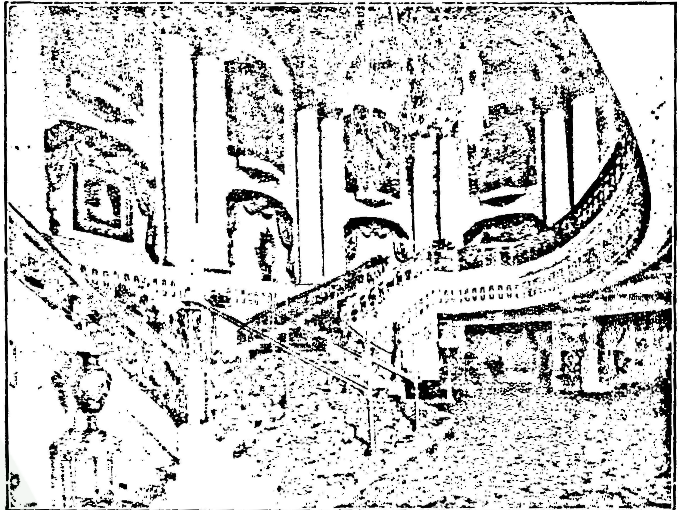
Fox Theatre di Washington noe katjida agrengna.

Dina parit ..... Maret ..... ioe, manah ieu mah piwaragadeunana moegi diarenggalkeun, kangge minochan fouds drukkerij tea.